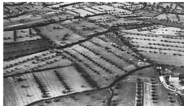
Le bocage agroforestier dans le Perche de l'Eure-et-Loir, près de Nogent-le-Rotrou en 1950

A2RC INRAE – Frédérique Santi 2163 Avenue de la Pomme de Pin – CS 40001 Ardon 45075 ORLEANS Cedex 2